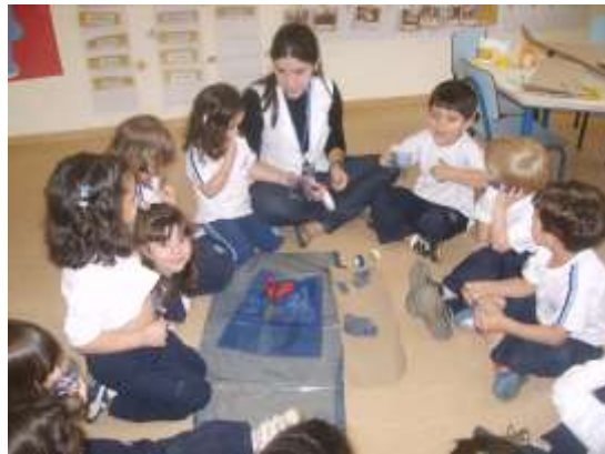
Aprendendo sobre o pato: Ele é um dos poucos animais da natureza que anda e nada.