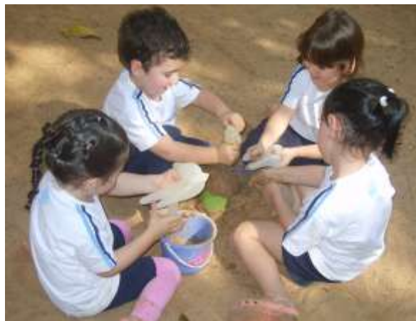
Crianças brincando de “ordenhar” o leite da vaca.