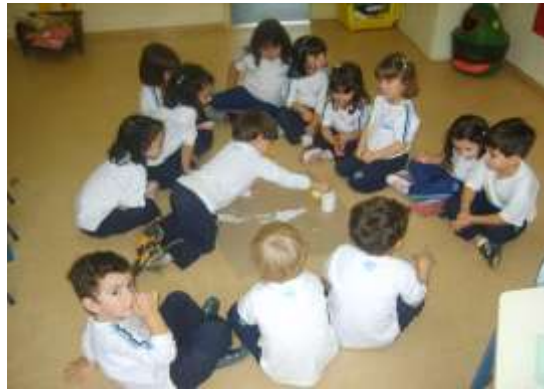
Turma pintando o pato.