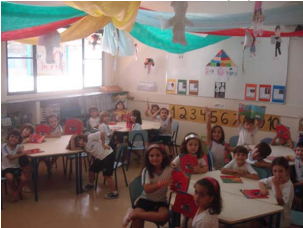
Infantil II A

Portanto, preparem-se: o espetáculo vai começar!