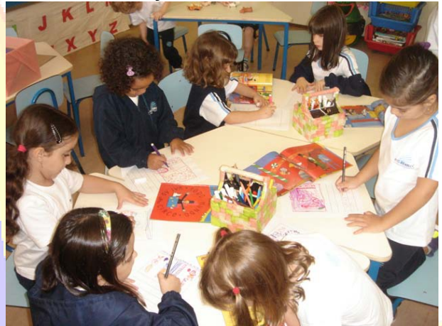
Infantil II B