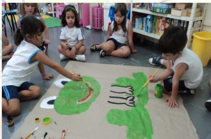
Alunos do Infantil I-D confeccionando a Rani, personagem principal do livro adotado neste semestre.