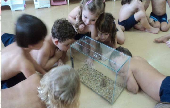
Alunos do Infantil I-C observando a Rã que apareceu no colégio durante uma brincadeira no parque.