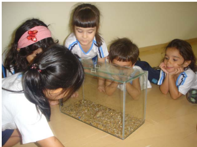
Alunos do Infantil I-B observando a Rã que apareceu no colégio durante uma brincadeira no parque.