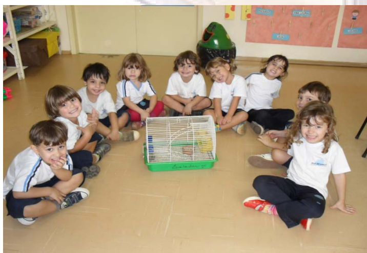
Alunos do Infantil I-A observando o ratinho de estimação trazido por uma coleguinha da sala.