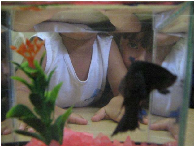
Observando o peixe