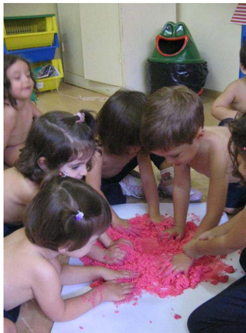
Pintura com sagu