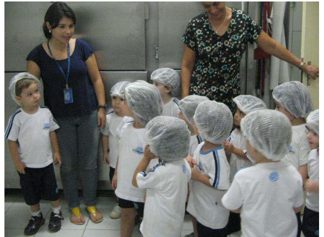
Visita na Cantina do Colégio