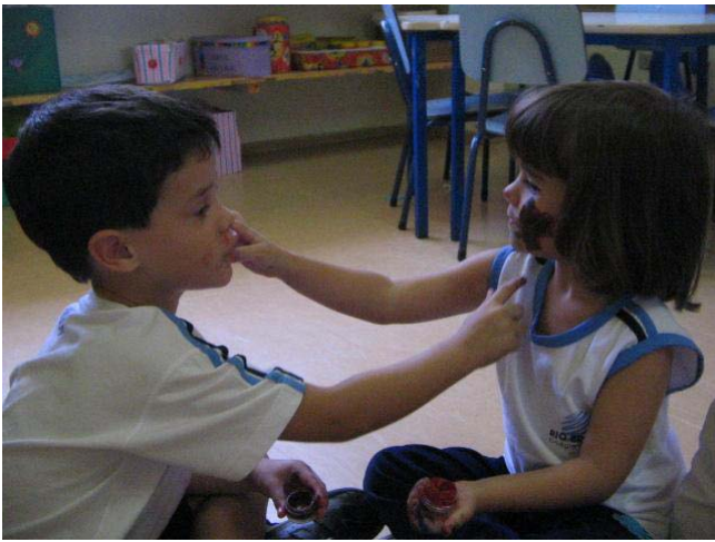
Maquiagem no rosto do amigo