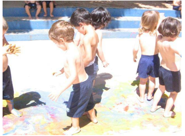
Pintura com os pés