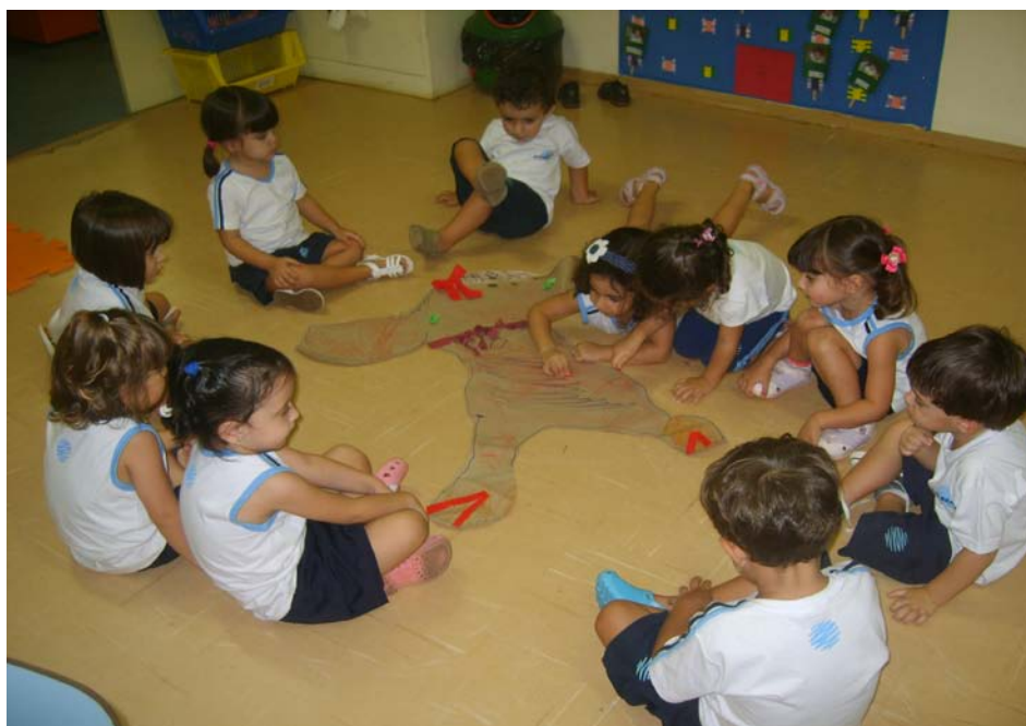
Pintando a figura humana.