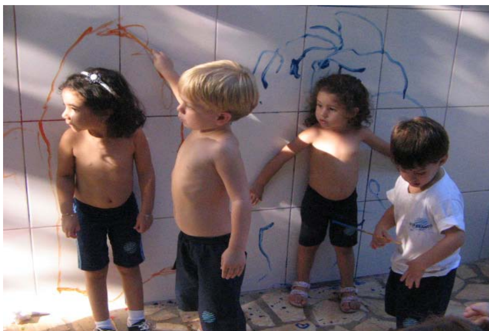
Contornando o corpo do amigo no azulejo.