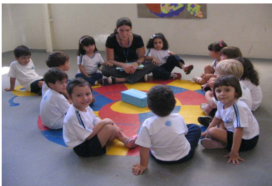
Roda de conversa: “Qual é o meu maior tesouro?”