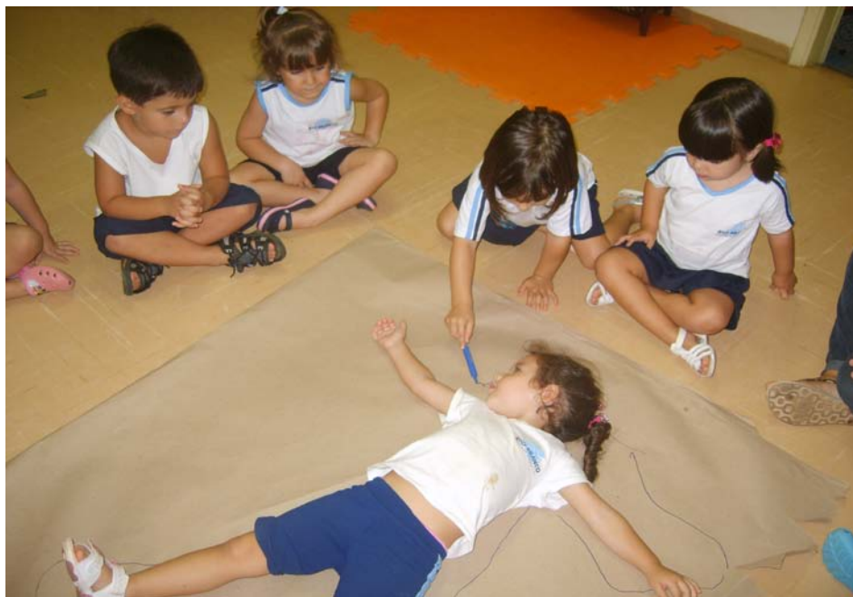
Contornando o corpo humano.