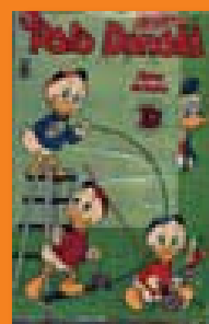
HQ de 1970: revistas do Sebo & Lojão para brincar de “volta ao passado”

Segundo Pedro, estudantes de todas as faixas etárias aparecem por lá para procurar livros indicados pelos professores. Muitos acabam virando fregueses que retornam sempre para verificar as novidades nas prateleiras. Apareça por lá para comemorar a longevidade da casa. E, desde já, nossos parabéns aos proprietários e frequentadores!