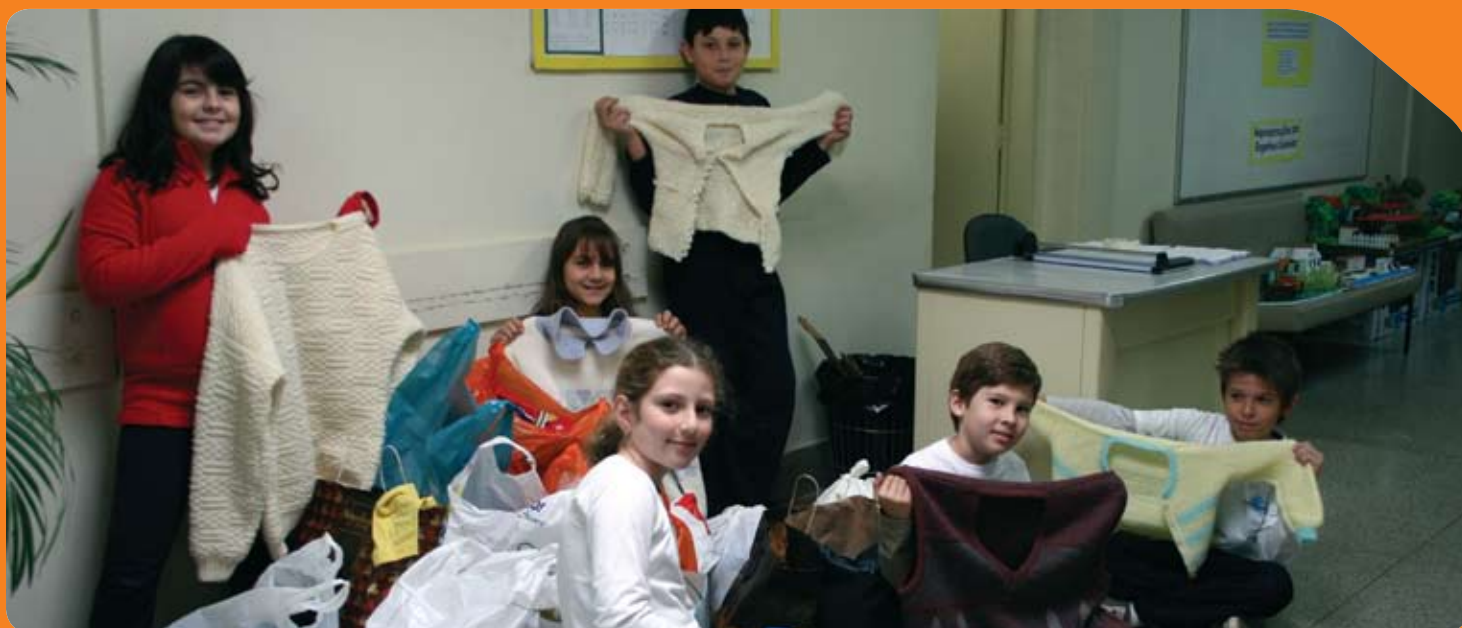
Para lentes do fotógrafo Sérgio Garcia Costa, alunos do RB com as doações da Campanha do Agasalho.