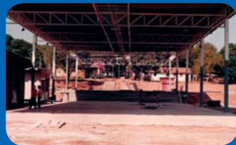
Fonte: Livro "Colégio Rio Branco: 130 anos de História", publicado pela Profa. Creusa Schenkel e seus alunos, em 1993.

O jornal Correio Popular noticiou, em 11 de março de 1975 que os diretores prometiam até junho a construção de mais oito salas, além da cantina e do pátio para as aulas de Educação Física. Além disso, informava também sobre os motoristas responsáveis pelo transporte escolar. Foram anos difíceis. Entretanto, apenas três anos depois, no dia 14 de abril de 1978, o Correio Popular novamente publicou matéria sobre o Colégio, informando que havia 680 alunos matriculados e a área construída já era de cinco mil metros quadrados.