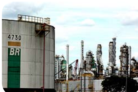
REPLAN - Paulínia

“No dia 29 de abril, acompanhamos os alunos do 2º ano do Ensino Médio em uma proveitosa visita à Replan, Refinaria de Paulínia, a maior refinaria do sistema Petrobrás, responsável pelo refino de 20% de todo o petróleo processado no Brasil. A visita monitorada é fornecida pela Petrobrás, como forma de apresentar às escolas o dia-a-dia da empresa. Após estarem trajados conforme preconiza o sistema de segurança da Replan, os alunos começaram o dia com uma palestra que apontou dados históricos e projeções futuras da empresa. Depois, a visita propriamente dita mostrou a destilação, o armazenamento e a logística de distribuição do combustível. O feed back dos alunos foi ótimo, pois a proximidade com a indústria funciona como uma aplicação prática do que é mostrado, em teoria, nas aulas. A experimentação da vivência da empresa pôde tirar o abstrato dos conceitos discutidos em sala.”